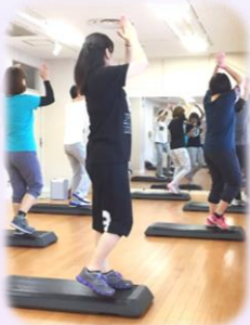
かんたんステップ