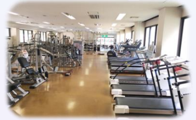
トレーニング教室