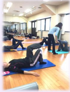
はじめてピラティス