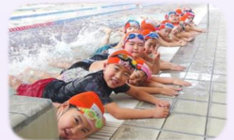
スイミングスクール