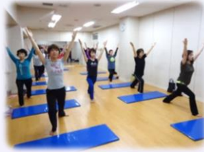
体幹エクササイズ&ベリー