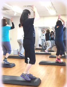
かんたんステップ