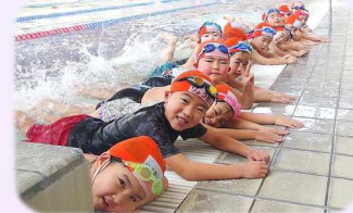
スイミングスクール