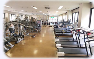
トレーニング教室