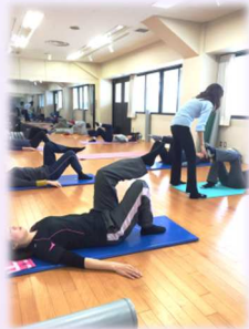
はじめてピラティス